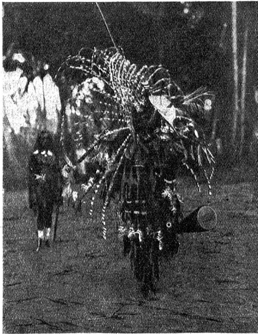
Bei den Papuas. Der Wellen- oder Meer-Dema.

Man erwartet, der Ausdruck bezeichne irgend einen Papua-Stamm, der im Herzen dieser noch wenig durchforschten Insel, ehemaligem deutschem, heutigem holländischem und englischem Kolonialbesitz, sein Menschenfresserwesen fristete. Aber dem ist nicht so. „Knall-Menschen“ bedeutet die Weißen. Der Ausdruck ist von den Ureinwohnern für sie gefunden worden, die mit ihren Knallscheitern den Urwald unruhig machen, die Wilden erschrecken und auf weite Entfernungen vom Leben zum Tode befördern, die Bestände an Paradiesvögeln und anderem Getiere ausrotten, um Federn und Bälge gegen Dollars und anderes wertvolles Geld umzutauschen, Steuern in Form von Kokosnüssen abfordern und mit Gewalt erzwingen, „unsittlich“ nachgehende