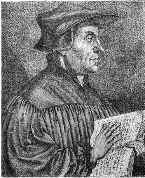
M. HULDRICUS ZWINGLIUS REFORMATOR ET PASTOR ECCLESIAE TIGURINAE. Aetatis 48. Obiit aetatis 48. die 11. octobris. Aetatis 48. Dum Patria quiesceret per dogmata sancta fatiscentem. Ingrato Patria celsus ab emte caelo.

Scheu, der Zucht und Sitte loderten sich. In hohlem Prunk erglänzte das falsche Söldnerglück und verführte den großen