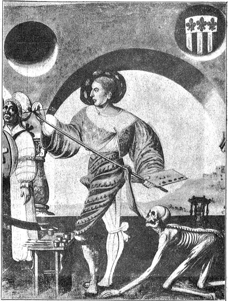
Niklaus Manuel als Maler der Totentanzbilder und Verfasser der saftnachtspiele an der Kreuzgasse, ein einflußreicher Verfechter der Reformation.

„Erzähl' mir von meinem Vater“, bat Rahel eines Tages. „Ich habe doch einen Vater gehabt?“ Ottilie erzählte, und das Bild, das sie vor dem Kinde erstehen ließ,