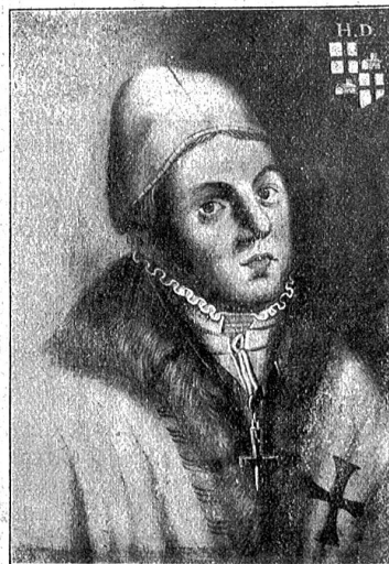
Deutsch-Ordens Bruder. Nach einem Bild im Historischen Museum in Bern.

Am wenigsten war die Geistlichkeit befähigt, das Gei- stige anzuregen und zu fördern. Sie besorgte rein äußerlich ihre Geschäfte, ließ sich dafür bezahlen und genoß im übrigen