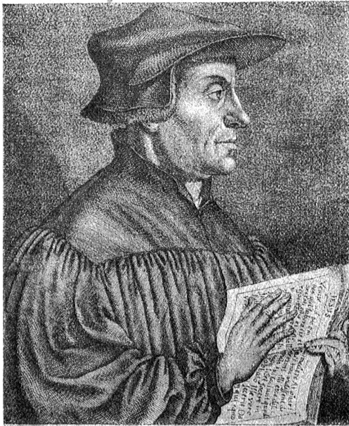
M. HULDRICUS ZWINGLIUS REFORMATOR ET PASTOR ECCLESIAE TIGURINAE. Aetate annorum Obiit aetatis 48. die 11 octob. Aetatis 48. Dum Patria quiesceret per dogmata sancta fatissem. Ingrato Patria celsus ab emte caelo.

Scheu, der Zucht und Sitte loderten sich. In hohlem Prunk erglänzte das falsche Söldnerglück und verführte den großen