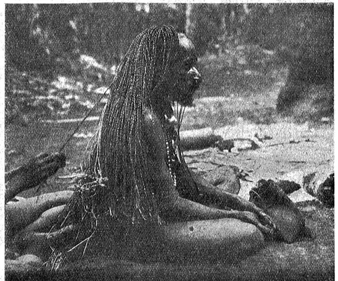
Bei den Papuas. Stelchen der haarverlängerungen in Saguée.

Nirgends war in den aus Sagoblattrippen verfertigten Wänden eine Oeffnung zu sehen, doch reichten diese auf allen vier Seiten nicht ganz bis zum Boden herab. Unter ihnen mußte man durchkriechen, um ins Innere zu gelangen,