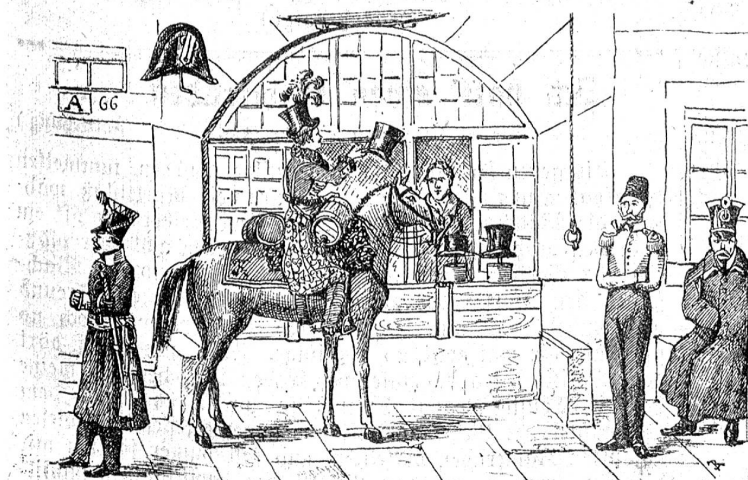
Oesterreichische Marketenderin vor dem Hutladen Staub am Stalden 1815.

Die Anforderungen, an das weibliche Dienstpersonal besonders, waren höher als heute im Zeitalter der Spezialisierungen; eine Perle nach den Anforderungen von Nr. 2 wäre jetzt kaum mit Gold aufzuwägen. Auch der Melker in Nr. 4, der zugleich säen kann, ist in unsern Tagen eine Seltenheit ersten Ranges; dabei ist aber zu bedenken, daß der ganze Kanton damals erst zwei oder drei Talkälereien hatte. Unter den „Hinterlagen“ der Kellermägde sind Kauttionen zu verstehen.