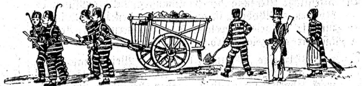
Schallenwerker in Bern 1830.