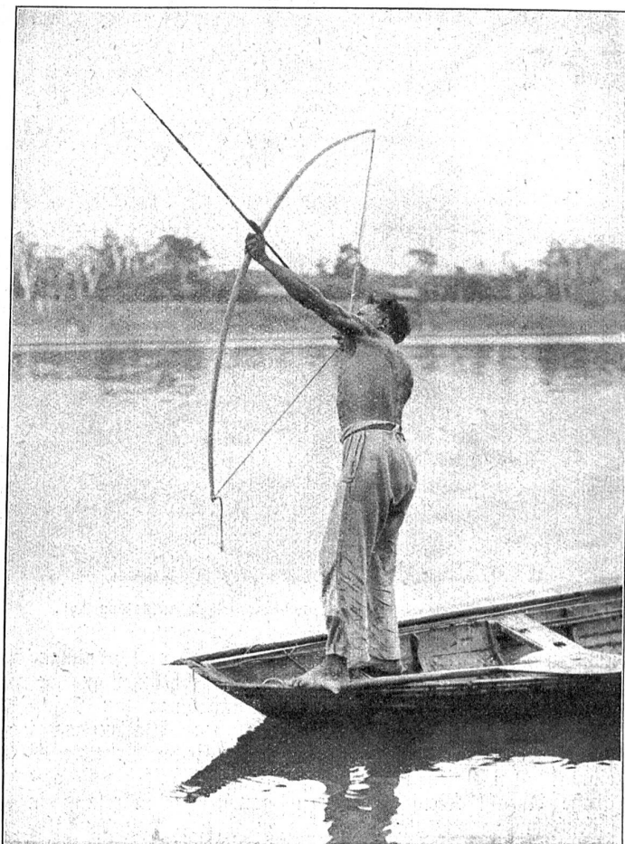
Jagd auf Araushildkröten. Der Pfeil wird so geschossen, daß er senkrecht auf das Tier herunter kommt.

Nun beginnt zum Schlusse die abenteuerlichste Fahrt der ganzen Reise. Das Boot ist überladen — die stöckdunkle Tropennacht bricht ein — und ein Gewitter mit Plakregen stürzt vom Himmel. Das Rudern wird unmöglich, man muß Wasser schöpfen und dafür sorgen, daß das kleine Fahrzeug, das sich in Wirbeln dreht, nicht kentert. Hier und da taucht ein Krokodil im Scheine eines Blitzes auf. Endlich hört der Regen und das Krachen der Donner auf, und vom Ufer hört man einen Hahn krähen. Dann sieht man ein rotes Licht erglänzen: das ist der Dampfer. Die durchnäßten Leute bringen das Gepäd zum Maschinen-