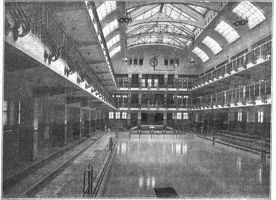
Städtisches Amalienbad in Wien (Schwimmhalle).

An deren Längsseiten sind Zuschauertribünen plaziert. Auch die Galerien im ersten und zweiten Stock sind für Zuschauer eingerichtet. Die Schwimmhalle bietet 553 Umkleegelegenheiten. Die Kabinen werden von hinten betreten und bloßfüßig vorne verlassen. Die Räume der Schwimmhalle dürfen nicht mit Schuhen betreten werden. Männer und Frauen sind gezwungen, vor Benutzung des Schwimmbassins ein Reinigungsbad zu passieren, wo Duschen und Fußwannen zur Verfügung stehen. Die Breite des Beckens ist so bemessen, daß 6 Schwimmer nebeneinander starten können. Der Boden neigt sich bis zu einer Tiefe von 4,80 Meter. Die Sprunganlage bietet federnde Bretter von 1 und 3 Meter und Plattformen von 5 und 10 Meter Höhe. Ein Kinderbad im Ausmaße von 12×5 Meter ist an der leichteren Seite unabhängig vom Bassin untergebracht.