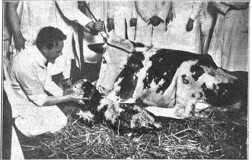
Mutterglück in der Geburtsklinik.

Daß in der Hochschule der Zucht und Pflege der Nutztiere, die uns Milchprodukte, Fleisch und andere Lebensmittel liefern, die also nützliche Arbeit leisten, besondere Aufmerksamkeit angewendet wird, muß nicht erst hervor-