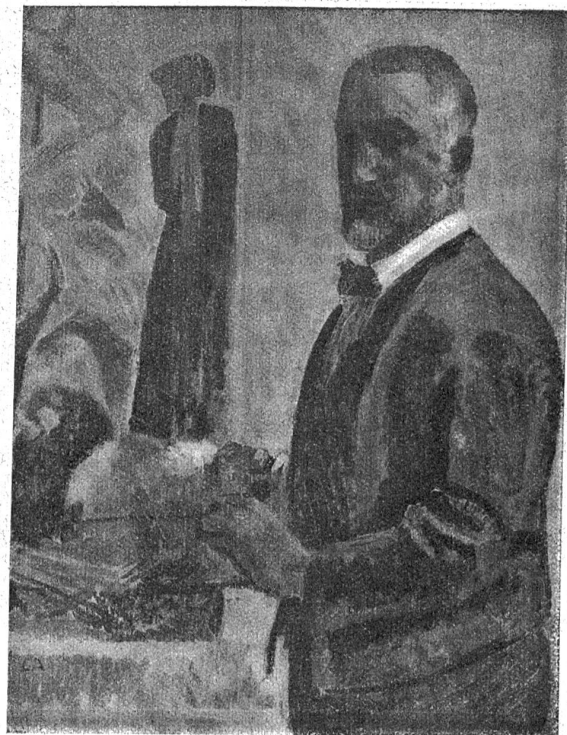
Cuno Amiet: Selbstbildnis.

Verlassen liegt Bad Blumenstein. Im Sommer werden hier die Menschen Erholung suchen. Jetzt braucht man keine Badefuren. Eine Schüssel jungen Salat, eine gehörige Nase voll Frühlingsluft, und man ist gesund! Ein hübscher Bauernbub zeigt uns den nächsten Weg nach Nebelschi. Querfeldein geht's. Man holt sich wohl einen tollen Schuh voll Dreck heraus, was tut's. Nun blinken die beiden Seelein herüber, die klaren, hellen Augen, in denen der trockige Kopf des Stod'orns sich spiegelt. Die Vorberge sind wie die modernen Dämchen; sie ziehen das weiße Röcklein weit über die Knie hinauf, und bald wird es nur noch ein Hemdchen sein, das ein frecher Windstoß über das Köpfchen weht und lachend ins dämmernde Tal hinunterwirft.