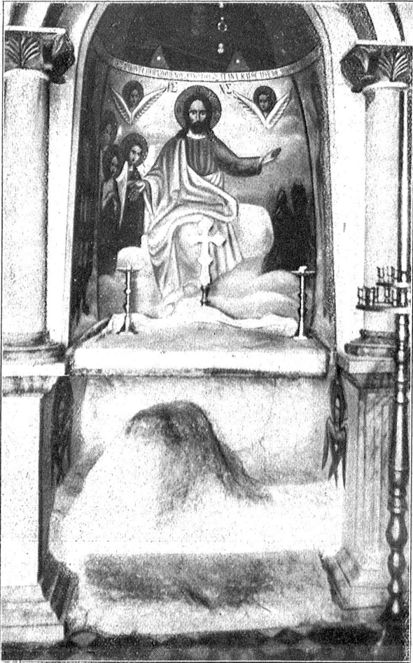
Die Cavesangst Christi-Grotte im Cal Josaphat am Oelberg. Sie ist das einzige Heiligtum, das sich noch im ursprünglichen Zustand befindet. Die nackten Selswände und Teile des steinigen Bodens sind ohne jeden Mörtelanwurf noch wie zu Zeiten Christi. Unser Bild zeigt den Hauptaltar der Cavesangstgrotte mit den kahlen Sellen unterhalb.

Als Rahel wiederkam zur gewohnten Stunde, klang ein Ton der Entfremdung in ihrer Stimme mit.