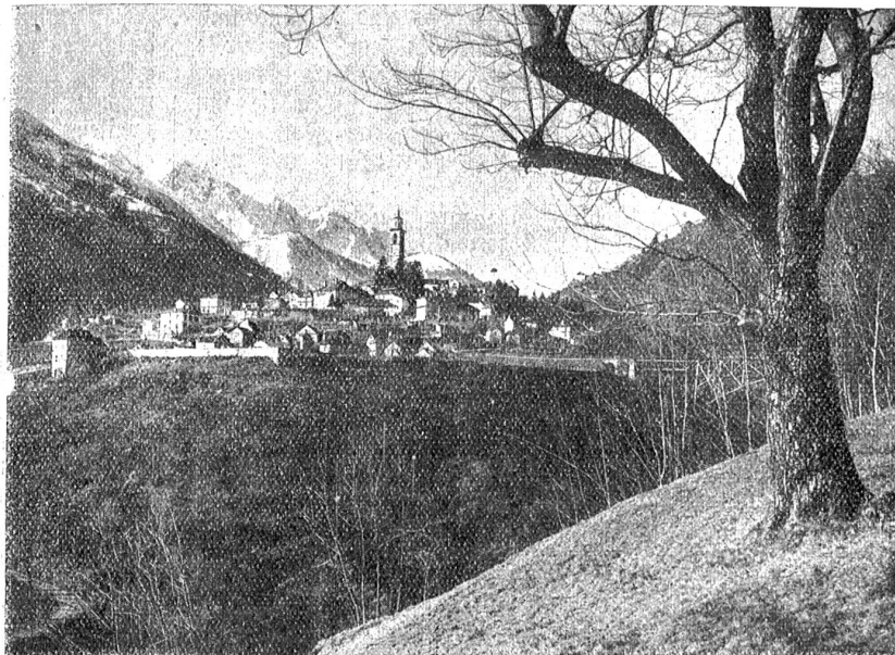
Intragna an der Centovallibahn.

Im großen ganzen macht „Der rote Adermann“ einen erfreulichen Eindruck, besonders im Vergleich mit den ersten Fibelnummerngebürten. Die Landwirtschaft nimmt eine herrschende Stelle ein; ökonomische und politische Einsparungen (natürlich vom bolschewistischen Standpunkte behandelt) werden drastisch dargestellt und fest eingedrillt. Diese Rücksicht auf die Muskeln und deren unbefiegbares Mißtrauen den Sowjetneuerungen gegenüber beweist, daß die neue Richtung der russischen Innenpolitik, die Lenin noch auf seinem Sterbebett diktierte, tiefe Wurzeln gefaßt hat. Die Sowjetregierung hat tatsächlich „das Gesicht dem Lande zugewendet“: sie sucht und manchmal findet sie auch praktische Wege zur friedlichen Eroberung der 100 Millionen russischer Landbewohner.