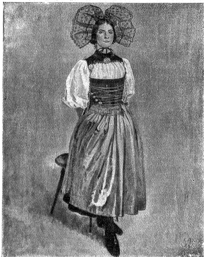
Cuno Amiet: Berner Mädchen (1924).

die hat Amiet mit seinem ureigensten Kunstmittel, mit der Farbe, glänzend zuwege gebracht. Keiner könnte ihm das so leicht nachmachen, keiner dürfte ihm das abschätzen.