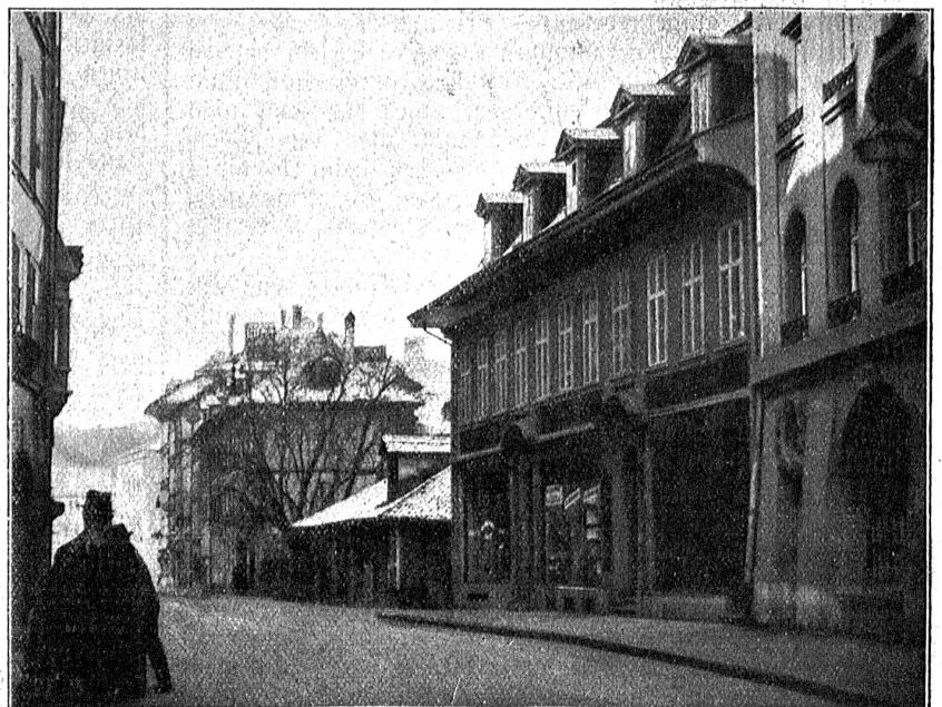
Ansicht der Neuengasse mit den Steuerwehmagazinen usw., an deren Stelle nun der Kyfflihof steht.