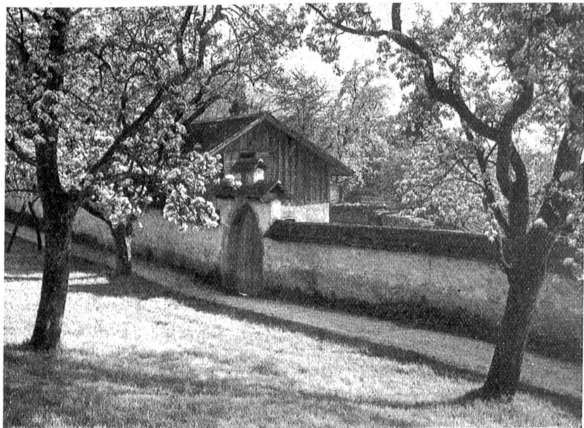
Frühling am Zugersee.

Der Rückweg führt dich durch das stattliche und industriereiche Baar. Mächtige Fabrikgebäude liegen an deinem Weg. Sie gehören der Baumwollspinnerei an und du wunderst dich über die großzügige, feudale Art dieses Betriebes.