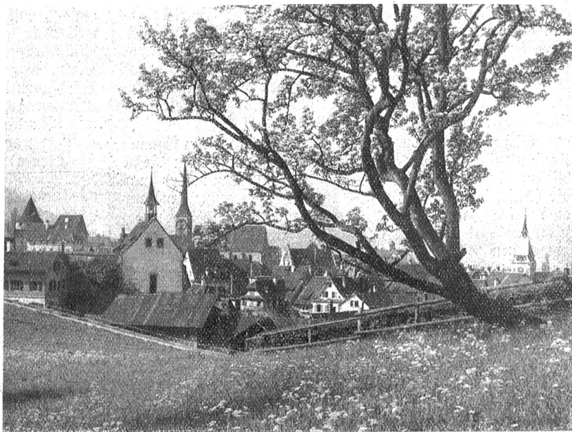
Frühling bei Zug.

Du verschweigst aber am Zuger Wirtshausstisch Klugerweise dein Wissen um die durch den Schwyzer Vater Wilhelm Siedler erwiesene Tatsache, daß das Denkmal zu Unrecht auf Zugerboden steht und eigentlich dort stehen sollte,