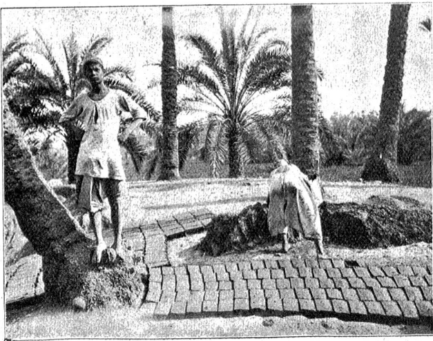
Milchschlammziegelei bei Memphis.

Alle innerhalb des Ueberschwemmungsgebietes des sich seit der Erhöhung des Staudammes von Assuan bis 295 Kilometer stromaufwärts erstreckenden Stausees liegenden Ortschaften Nordnubiens sind vom Tal in die Höhe, über die jetzige Hochflutmarke verlegt worden, weshalb man dort meist neue Häuser sieht, während zahlreiche Dorfruinen teils unter Wasser, teils an dessen Rand stehen. Unter Wasser stehen ferner zu Tausenden die Palmen, zum größten Teil Dattelpalmen, die früher den Nil einfakten und von denen heute oft nur noch die Wipfel aus dem Wasser ragen. Ihren Kampf ums Dasein scheinen diese Bäume siegreich zu bestehen, denn obwohl er schon viele Jahre dauert, sehen sie ganz gesund aus. Zahlreiches Geflügel im Strom und auf den Sandbänken, in malerischen Gruppen und biblischen Gewändern am Ufer kauende Männer, Frauen und Kinder, auf den als Straßen benützten Dämmen wie Silhouetten aussehende, oft hochbeladene Kamele, ferner Esel, Büffel, Schafe, Ziegen, vom Fluß kommende Fellachen mit aus Ziegenhäuten hergestellten Schläuchen voll zu Trinkzwecken bestimmten, trüben, aber nach Meinung der Eingeborenen