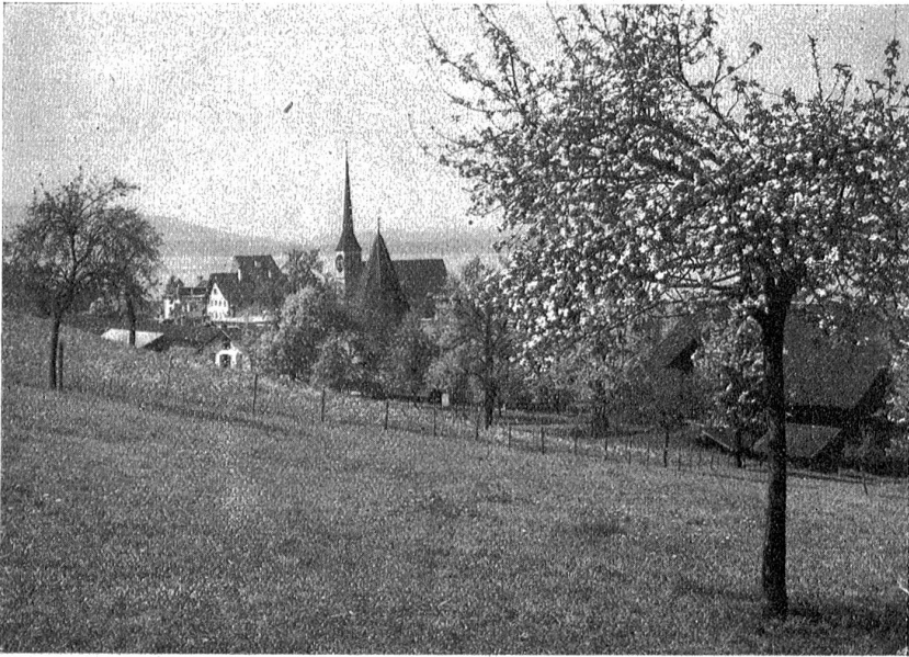
Frühling am Zugersee.

laue Luft zu trinken. Blendendweiße Anemonen gucken neugierig unter welchem Gestrüppe hervor, und morgen schon nicken auf tausend und abertausend saftigen Stengelein die goldgelben Dolden der wohlriechenden Primel. Buntfarbige Schmetterlinge, so wunderbar schön, wie ich sie noch selten gesehen, beginnen ihren Frühlingsreigen zu tanzen. Im Geäst der saftgrünen Lärchen singen und spielen die Vögel und lassen sich wiegen vom Winde; auf der warmen Mauer am Wege sonnt sich eine grünlichgelbe Eidechse, hebt den leuchtendblauen Hals und Kopf in die Höhe und guckt mich mit ihren glänzenden Augen unverwandt an. Das schwarze Gabelzünglein ist in steter Bewegung, doch sobald ich mich nähere, verschwindet das schöne Tierchen in raschelndem Laub. An der grauen, sonnendurchwärmten Mauer erblicken büschelweise die blauen Veilchen und die weißen Maßliebchen; junger, feingliederter Mauerfarn ziert die Steinwände mit blaugrünen Sternen; bald werden es dunkelgrüne Strahlenbüschel sein. Dazwischen hängen an feiner Wurzel wunderhübsche traubenähnliche Mauerpflänzchen in blau-grün-rosafaschimmernder Farbe. Andere sehen aus wie in die Mauerfugen gepreßte, maigrüne Fichtenzweige und wieder andere bilden kleine, weinrote Teppiche. So sind in kurzer Zeit alle die trockenen Mauern zu lebensfrohem, blühendem Leben erwacht.