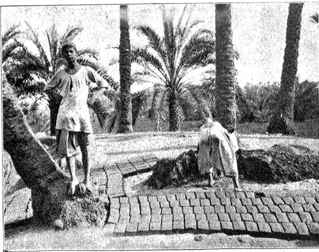
Milchschlammziegelei bei Memphis.

Alle innerhalb des Ueberschwemmungsgebietes des sich seit der Erhöhung des Staudammes von Assuan bis 295 Kilometer stromaufwärts erstreckenden Stausees liegenden Ortschaften Nordnubiens sind vom Tal in die Höhe, über die jetzige Hochflutmarke verlegt worden, weshalb man dort meist neue Häuser sieht, während zahlreiche Dorfruinen teils unter Wasser, teils an dessen Rand stehen. Unter Wasser stehen ferner zu Tausenden die Palmen, zum größten Teil Dattelpalmen, die früher den Nil einfakten und von denen heute oft nur noch die Wipfel aus dem Wasser ragen. Ihren Kampf ums Dasein scheinen diese Bäume siegreich zu bestehen, denn obwohl er schon viele Jahre dauert, sehen sie ganz gesund aus. Zahlreiches Geflügel im Strom und auf den Sandbänken, in malerischen Gruppen und biblischen Gewändern am Ufer kauende Männer, Frauen und Kinder, auf den als Straßen benützten Dämmen wie Silhouetten aussehende, oft hochbeladene Kamele, ferner Esel, Büffel, Schafe, Ziegen, vom Fluß kommende Fellachen mit aus Ziegenhäuten hergestellten Schläuchen voll zu Trinkzwecken bestimmten, trüben, aber nach Meinung der Eingeborenen