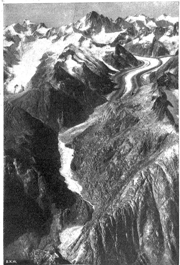
Siegerbild auf Oberaargletscher (links), Unteraargletscher (rechts) und Aarboden (Mitte), der unter Wasser kommt. Ganz unten Logierhaus auf Rollen.

Der Grimselsee von 100 Millionen Kubikmeter nutzbarem Wasserinhalt entsteht durch die Abriegelung der Aare in der Spitalamm und auf der Seeuferegg durch zwei große Sperren und wird sich bei einem Höchsttau auf Höhe 1912 vom unteren Ende des Unteraargletschers rund 5,5 Kilometer nach Osten bis über die heutigen Grimselseen hinaus erstrecken. Sein Untergrund ist vom Gletscher der Eiszeit ausgeschliffener, wasserdichter Granitboden, der in Jahrtausende langer Arbeit mit Gletscherschutt und Sand über-