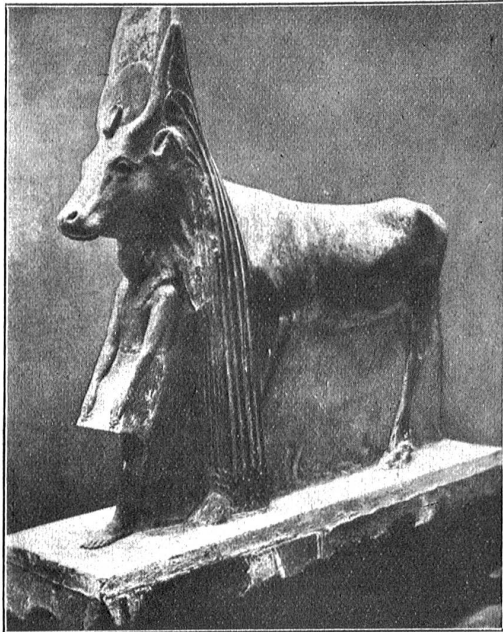
Hathor als Kuh.

Diese Anspielung auf tierische Züge im Gesicht mancher Menschen beliebt man aber nicht etwa so aufzufassen, wie