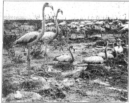
Flamingos beim Brüten.

der Zauber ewiger Verjüngung, obwohl der zu ihrem Sinnbild erhobene Reiher Phönix, dieser heilige, aber von jeher durch Abwesenheit glänzende Vogel auch mit dem Feldstecher nicht zu entdecken ist. Mit ihrer Gegenwart erfreuen uns dagegen unsere Fischreiher, sowie eine Menge Reiher anderer Arten, nicht zu vergessen den Kuhreier,