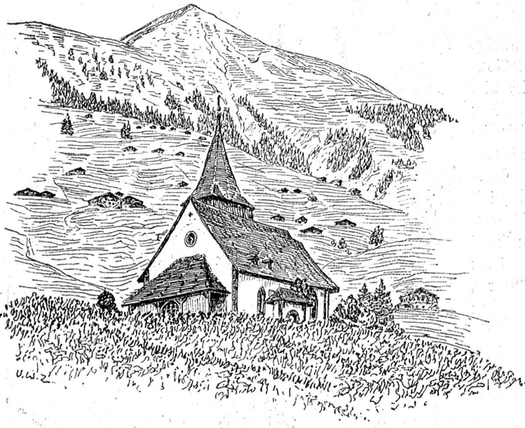
Kirchlein in Lauenen.

Zeichnung von U. W. Zürcher in Ein. Sriedlis „Saanen“, Verlag A. Franke A. G. Bern.