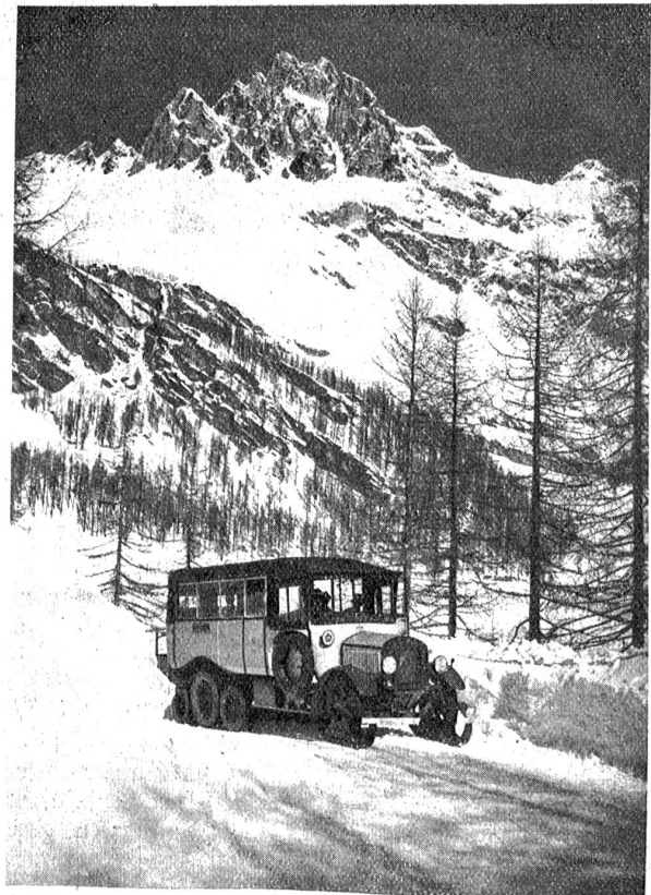
Der Raupenbandwagen, wie er für Winterbetrieb auf den Strecken Reichenau—Waldhaus Flims, Chur—Lenzerheide und St. Moritz—Maloja—Castasegna verwendet wird.

Die hier reproduzierte Kartenskizze gibt einen Ueberblick über die bis heute in Betrieb gesetzten Alpenposten. Weitere Linien werden folgen, soweit ausgebaute Alpenstraßen bestehen, und auf den bestehenden Linien wird der Verkehr