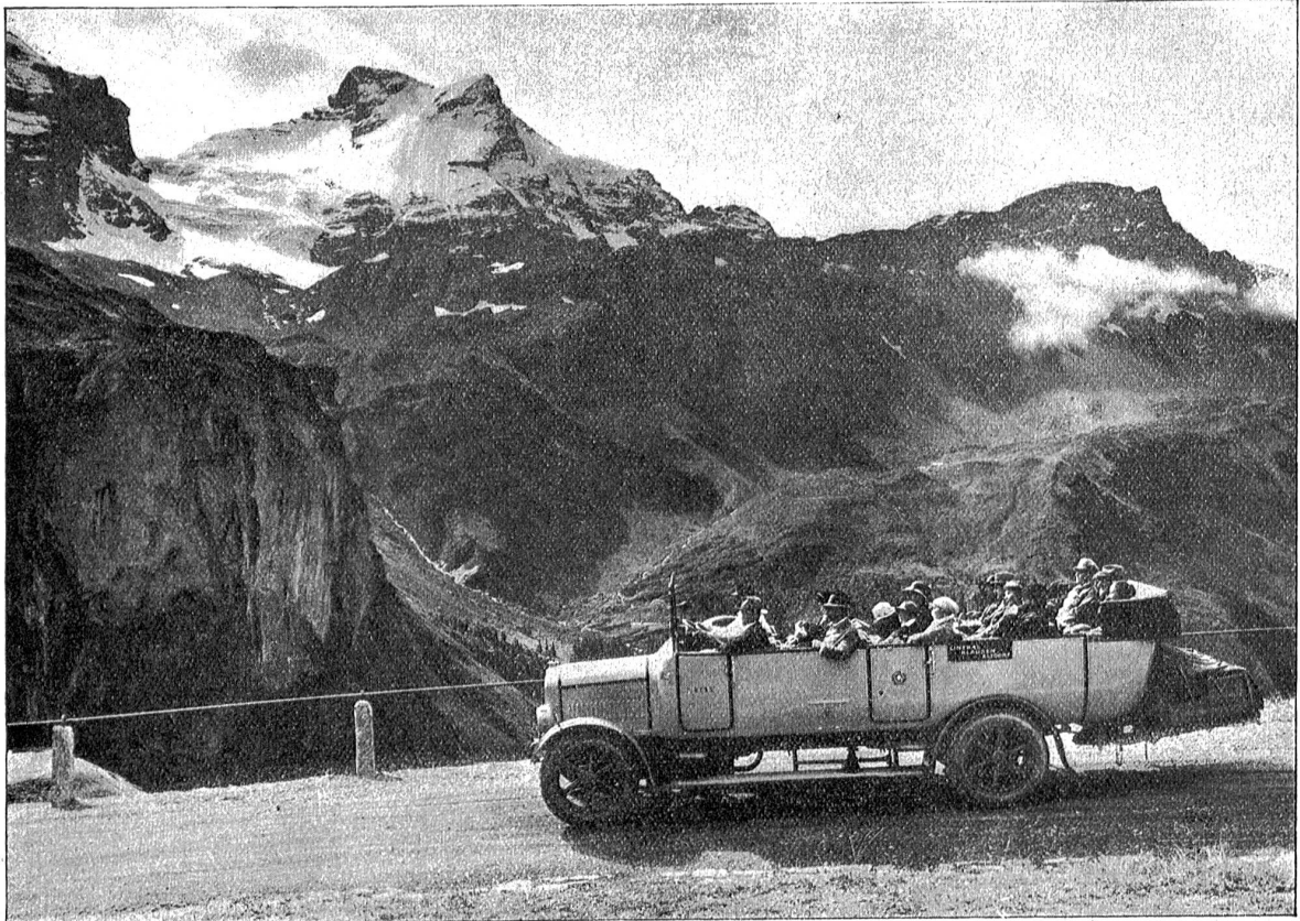
Auf dem Klauenpaß. Im Hintergrund das Scheerhorn.