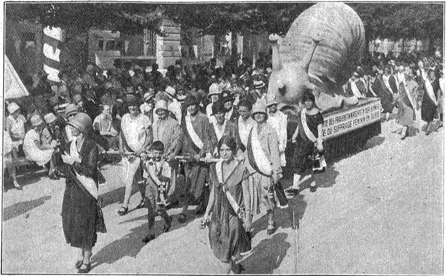
Aus dem „Saffa“-Festzug: Die Schnecke der Frauenstimmrechtlerinnen.

Gleich beim Eingang in die Halle des Handels stoßen wir auf unseren ersten Leitgedanken. Da hängen ver-