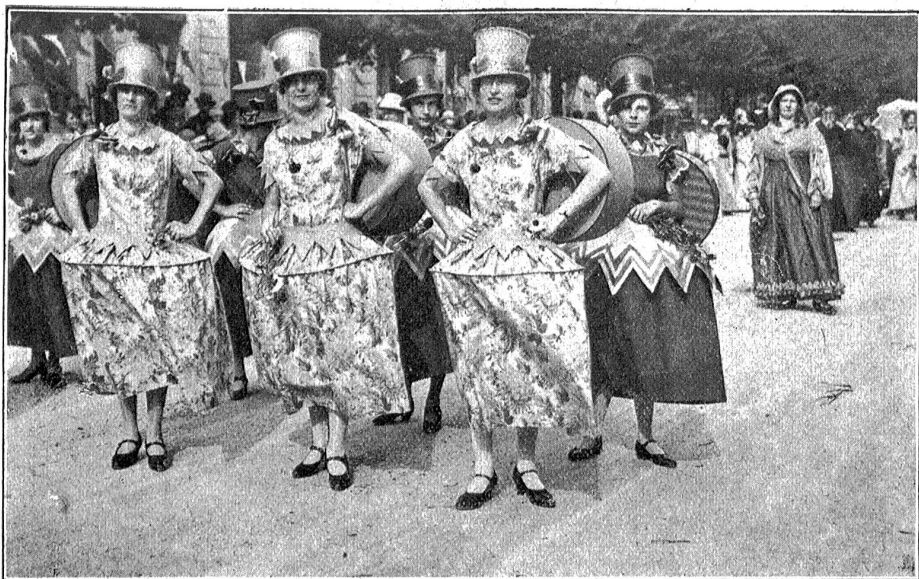
Aus dem „Saffa“-Festzug: Modistinnen.

werden. Sie begehrte, kleine Reisen zu machen, oder wünschte, fremde Länder zu sehen. Sie fuhr oft in die Stadt, ritt öfters als sonst, fuhr täglich im Kahn, lud sich Bekannte und Freunde ein, und wurde ungeduldig Johannes gegenüber, der mit Befremden diese Veränderung wahrnahm, noch ehe sie deutlich geworden. Er mühte sich, Rahel zu verstehen, und es gelang ihm, durch seine immer und immer sich gleichbleibende Liebe ihr gegenüber, auch sie wieder an seiner Ruhe teilnehmen zu lassen. Aber nicht lange. Rahel erwachte neuerdings zu verändertem Wesen, wurde still, scheu, langweilte sich, saß stundenlang auf der kleinen Bank im Weinberg, oder ging, als es kühler wurde, am See entlang, grübelnd, schwere Gedanken von Zeit zu Zeit mit Gewalt verjagend, dann wieder seufzend, und endlich sogar in Tränen ausbrechend. Und wußte nicht warum. Sie sagte sich, daß sie alles habe, was sie je hätte wünschen können, daß sie überhäuft werde mit Liebe, Geschenken, Bewunderung und Anerkennung, daß sie Herrin eines schönen Besitztums sei, angenehme Arbeit habe, ihr Pferd, das sie liebte, reiten konnte, so oft sie wollte, aber das alles waren Worte für sie, die nicht von Gefühlen begleitet wurden und deshalb leer blieben.