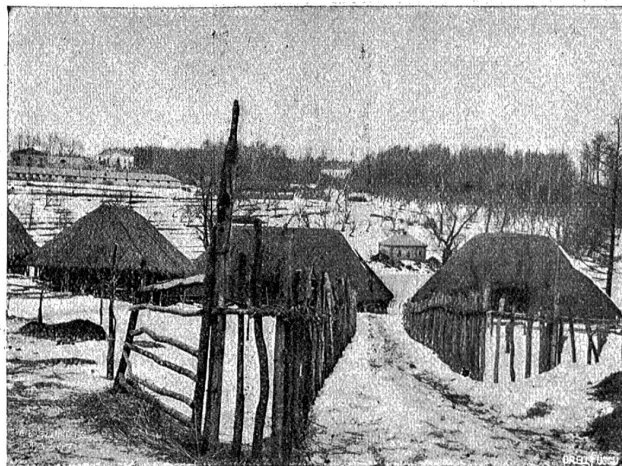
Herrenhaus und Wirtschaftsgebäude in Jasnaja Poljana.

hinter den großen und größten Werken der Weltliteratur, „Krieg und Frieden“, „Anna Karenina“, „Die Auferstehung“, „Die Kreutzerfonate“. Hier erörterte Tolstoi jene schweren Probleme, denen man so gerne aus dem Wege geht. Sie