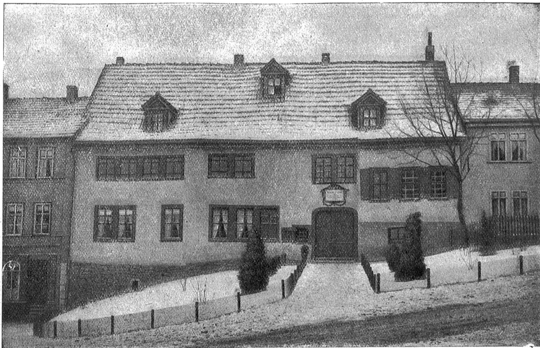
Das Geburtshaus von Johann Sebastian Bach in Eisenach.

Die Klingel himmelt altmodisch blechern, wie wir daran ziehen, dann öffnet sich die braune blankte Haustür mit dem Türklopfer aus Messing. Ein Strom von Licht und Glanz und Sonne strömt uns entgegen und spielt auf den roten Fliesen des Hausflurs. Das warme Licht kommt durch die gegenüberliegende Tür, die weit offen steht und in den