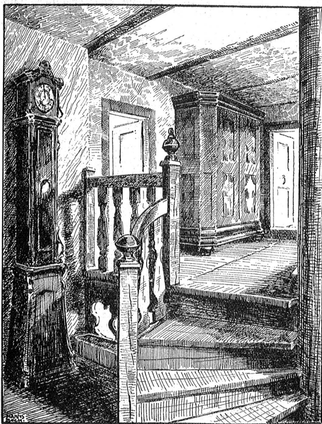
Inneres des Bachhauses. Die Holzterrappe mit der schön gegliederten Lehne.

Und mit welcher Hingabe diente er der Frau Musica! Mit heller Knabenstimme sang er als Kurrendeschüler mit andern stimmbegabten Kameraden, wie einst Martin Luther, vor den Häusern in Eisenach und wie oft saß er stundenlang am Klavier, schon damals eigene Kompositionen versuchend.