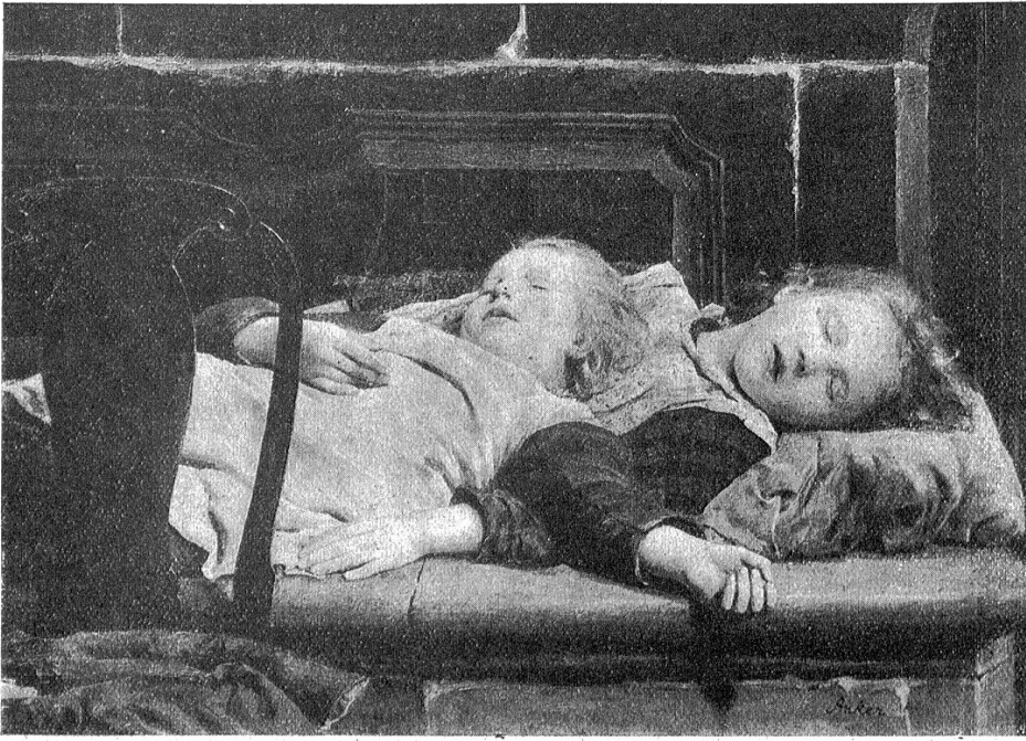
Albert Anker: Auf dem Ofen.