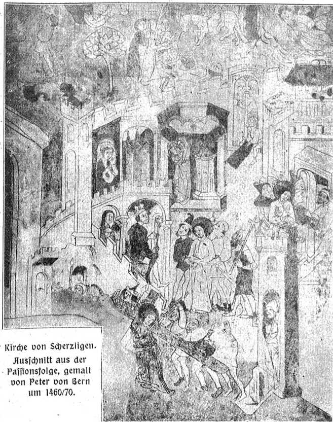
Kirche von Scherzliggen. Ausschnitt aus der Passionsfolge, gemalt von Peter von Bern um 1460/70.

weist auf die Zeit um 1450 bis 1470; zudem spürt man deutlich den Zusammenhang mit der damaligen Glasmalerei, so daß die Vermutung nahe liegt, der Künstler sei auch auf diesem Gebiete tätig und heimisch gewesen.