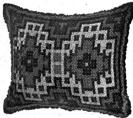
Fig. 2. Sophalissen in Maurischer Filetarbeit.

kann im Filetstopfstick, in einfachem Durchzug, oder jedes Häuschen verkehrt, ausgeführt werden, wie nebenstehendes Gliche zeigt, je nach dem Effekt, den man zu erzielen wünscht. Jeder Faden vom Filet wird 4 mal mit Wolle gedeckt, resp. 8 mal, 4 oben (rechte Seite) 4 mal unten (linke Seite). Die Dessins werden nach farbig vorgezeichneten Vorlagen gearbeitet. Als Abschluß und Umrandung verwendet man mit Vorliebe Cordons in denselben Farben wie an der Arbeit verwendet, auch Lustmaschenbogen wirken sehr gut.