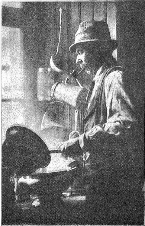
Bergfahrer in der Klubbhütte.

fühls, um das wir nur da oben reicher werden können. Die bange Frage beschäftigt alle: Welche Schwierigkeiten stellt uns der Gipfelgrat entgegen, sind die Griffe vereist, weht