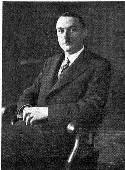
Dr. Marcel Bilet-Golaz, der neugewählte Bundesrat.

Von den Neugewählten hat Bundespräsident Haab die Würde des Bundespräsidenten nun schon zum zweiten Male inne. Nachdem er in seinem Heimatkanton Gemeindepräsident von Wädenswil, Oberrichter und Regierungsrat gewesen, wurde er 1911 als fünfundsiebzehnjähriger in die Generaldirektion der S. B. B. berufen. 1917 übernahm er die schweizerische Gesandtschaft in Berlin, wurde aber schon 1918 zum Bundesrat gewählt und heimberufen. Er leitete als Vorsteher des Eisenbahndepartements die mustergültige