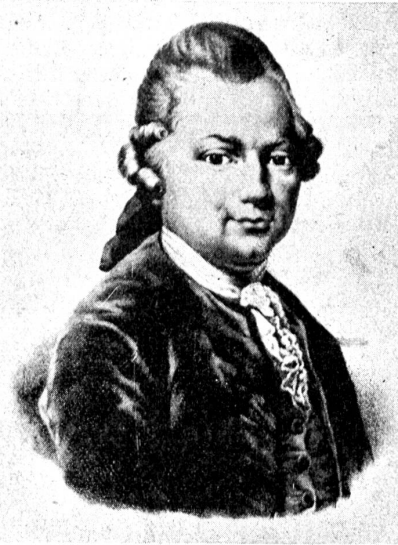
Gottfried Ephraim Lessing.

stein für die Richtigkeit seiner Theorien. Unter seiner Hand gestalteten sich jedoch Stücke wie „Emilia Galotti“, „Minna von Barnhelm“ oder sein letztes „Nathan der Weise“ zu