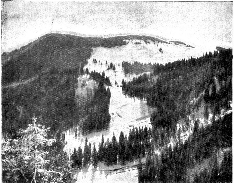
Winter im Schwarzwald.

Es ist halb drei Uhr, halb drei Uhr früh, mußt Du verstehen. Eben geht der Mond unter. Ich bin in einer seltsamen Stimmung, ich meine entzweierte zu werden. Vor meinem Fenster im Garten raschelt welkes Laub. Das tönt traurig. Aber von der Gasse her singt der Brunnen, oder jubelt er? So dringt es mir zwiespältig zum Fenster herein, weil es auch in mir zwiespältig ist. Die Außenwelt ist das Echo der Innenwelt. Du wirst denken, ich sei übergeschwappt. Vielleicht! Tatsache ist, daß ich sehr traurig bin, aber ich werde gleichzeitig vom Glück fast vom Stuhl gerissen. Ich hätte nie geglaubt, daß Traurigkeit und Glück so nahe beieinander wohnen könnten. Warum sollte ich viele Worte machen! Du hast es schon erraten, Du Kluge! Ich bin verliebt, verlobt. Nun ist das Wort heraus, der Schlag geführt! Begreiffst Du jetzt, daß ich traurig bin, Deinetwegen? Du wirst mich schelten, verachten. Aber nein, rede ich mir ein, sie ist zu gütig dazu. So muß ich selber mein Richter sein und mich verurteilen! Oh, ich habe es schon getan, draußen auf dem Feld unter den Sternen. Wie schmutzig kam ich mir unter ihnen vor. Aber es gibt Schicksale, denen man nicht enttrinnen kann. Die Sonne fragt