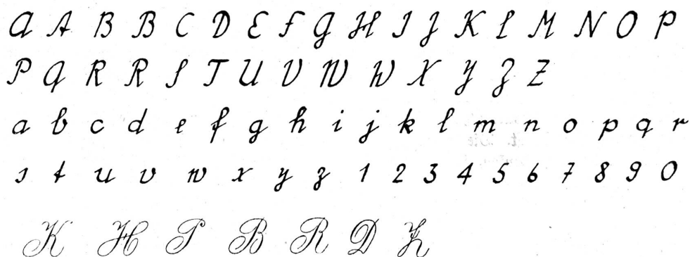
Die neuen, vereinfachten Buchstabenformen und unten einige der dekorativen bisherigen Spitzfederformen. Um den Formen Festigkeit zu geben, benötigte das Spitzfeder-Alphabet 106 Schwelllinien; im neuen A B C leisten 33 Eckwenden in 3 Mal weniger Zeit den gleichen Dienst.

Unsere heutige Schrift ist weder eine Wortbilderchrift (wie bei gewissen Naturvölkern) noch eine Silbenschrift (wie die Keilschrift der alten Babylonier), sondern eine Lautbuchstabenschrift. Für die einzelnen Laute besitzen wir bestimmte Zeichen, die wir beliebig zu Silben und Wörtern zusammenstellen können. Die Entwicklung zur Lautbuchstabenschrift konnte natürlich erst dann zustande kommen, als es den Menschen gelang, aus der Klangeinheit eines Wortes dessen einzelne Laute herauszuhören. Durch die Erfindung der Lautbuchstabenschrift wurde dem Schreiben erst eine allgemeinere Verbreitung zuteil, da die zu beherrschende große Zahl Schriftzeichen der Bilder- und Silbenschrift auf ungefähr dreißig zusammen schmolz.