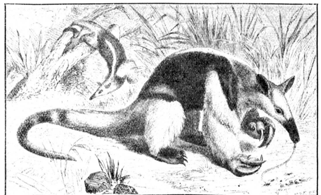
Tamandua ( Tamandua tetradactyla ). Ameisenbär. (Aus „Brehms Tierleben“.)