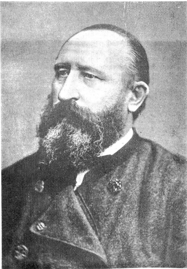
Alfred Edmund Brehm. — Die letzte Aufnahme des großen Gelehrten.

Alfred Brehm war wie selten ein Naturforscher für seine Forschungsarbeit vorbereitet. Sein Vater, Pastor in