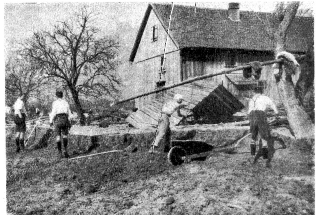
Sand! Sand! Man beachte die dicke Schicht.

Während alle andern Pfader hier in Ruggell wohnen, haben wir unser Kantonement im nahen Schweizerdorfe Grabs. Wir müssen schon um vier Uhr aufstehen. Mit unsern Fahrrädern gelangen wir bald auf den Arbeitsplatz. 5.30 Uhr. „Allons! enfants de la patrie!“, aber nicht mit Waffen, nein, bewaffnet mit Schaufel und Pickel. Hinaus auf die öde Sandwüste! Wir streifen an einem gefäulerten Felde vorbei, aha, das haben die wackern Basler im Frühling geleistet. Weiter. Sie und da ragen Baumstämme aus dem Sand, auch ganze Bäume, dann Balken von abgetragenen Hütten, sonst immer Sand, viel Sand! Was der Rhein nur alles hat mitlaufen lassen. Wir sind am Platze. 6 Stunden Arbeit liegen vor uns! Mutig, mutig, liebe Brüder... Schon fliegen die ersten Schaufeln Sand in die Rollwagen. Die Arbeit rückt, wir sind noch frisch. Aber merkwürdig, kein „Eingeborner“, kein Bauer bestellt sein Feld oder hilft mit, seinen Acker auszuebnen. Wir denken, natürlich, wenn man so einen lieben Fürst, einen freundlichen Millionär hat, da braucht man doch nicht zu arbeiten. Aber