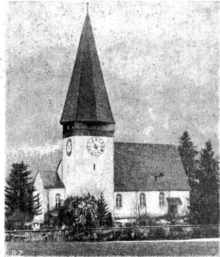
Die Kirche von Saanen, in der die Sresken aus dem XV. Jahrh. entdeckt wurden.

Er stellte den Stuhl weg und kniete vor dem Geldschrank nieder. „Ich knie hier zur Anbetung und Erniedrigung wie ich eigentlich immer kniete“, begann er tonlos. „Ich