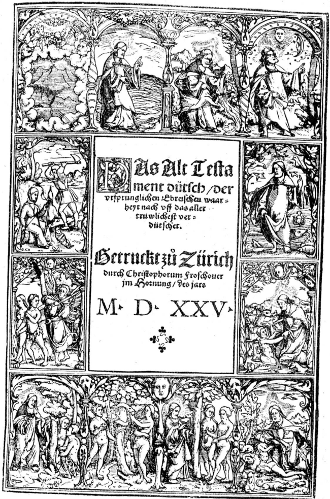
Titelblatt der Froschauerbibel (1525—29).

Er verwendete nur das beste Papier, ließ sich nie von seinem Profit leiten, sondern stets nur von der guten Sache, nahm