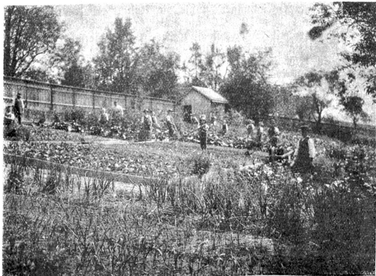
Bernische Erziehungsanstalt für Knaben in Landorf bei Köniz: Die Zöglinge beim Garten.

Beschlossen wurde die Gründung der Speiseanstalt am 6. September 1877 während einer Zu-