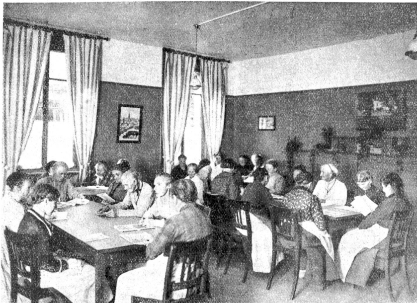
Anstalt Koblwil. — Aufenthaltsraum für Frauen.

Im zweiten Teil des Vortrages wurden den Anwesenden die verschiedenen Anstalten im Bilde vorgeführt, der Reihenfolge nach die großen Verpflegungsanstalten, die rein staatlichen und die staatlich unterstützten Erziehungsanstalten, sowie die Anstalten für schwachsinigige Kinder. Waren früher die Insassen der Armenverpflegungsanstalten in Massenquartieren kaserniert und versorgt worden, so erfreuen sich dieselben heute eines beschaulichen Daseins. Überall herrscht Ordnung und peinliche Sauberkeit. Die großen Schlafräume verschwinden. Die Teilung derselben geht bis zu Zweier- und Einzelzimmern. Eine große Wohltat für alle ist die Arbeitsbeschaffung, der ein jeder teilhaftig werden kann. Wenn Hilthy sagt, das ursprünglichste aller Menschenrechte ist das Recht auf Arbeit, so gilt dies nicht zuletzt für Anstaltsinsassen, auch für alte, gebrechliche Leute, die außer Konkurrenz stehen und deren Existenzberechtigung gewinnt, wenn sie noch, wenn auch mit schwachen Kräften, nützliche Arbeit verrichten können. Es ist für den Besucher einer solchen Anstalt ein erfreuliches Bild, die zufriedenen Gesichter der Insassen zu sehen, bei Verrichtung ihrer Arbeit, in Scheune, Werkstatt, Arbeitsaal, auf dem Holzplatz oder bei der Feldarbeit. Gar mancher Pflegling, der bisher, sei es durch fremde oder eigene Schuld, auf der Schattenseite des Lebens gewandelt ist, fühlt sich wieder als Mensch, wenn er als Mensch behandelt wird. Für alle aber scheint die Sonne eines sorglosen Lebensabends.