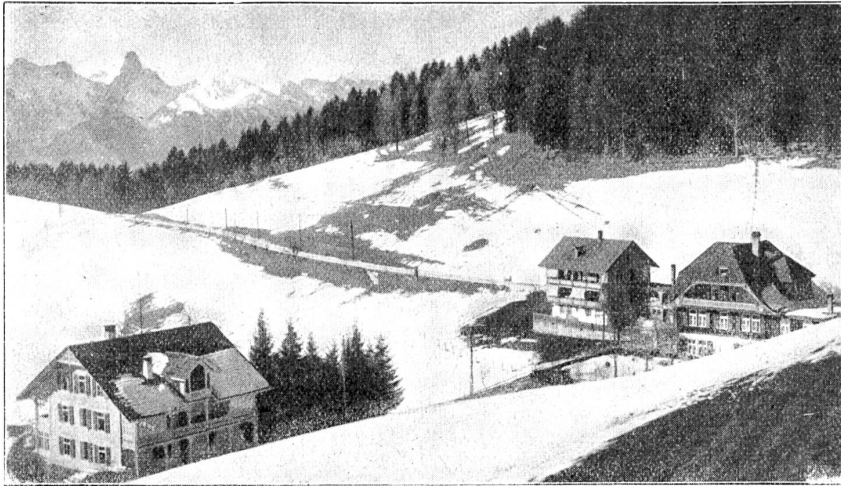
Häusergruppe in Schwendi.