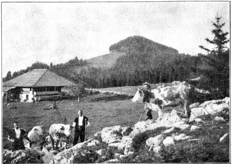
Berghaus bei Schwanden.