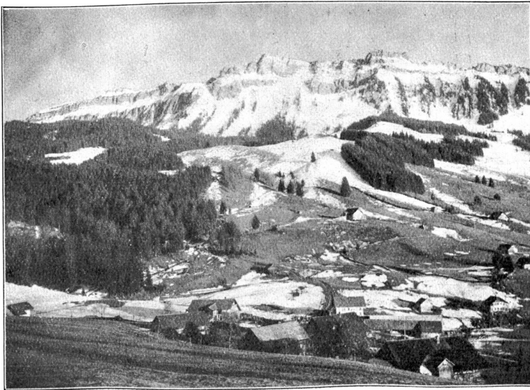
Schwanden mit Grat.