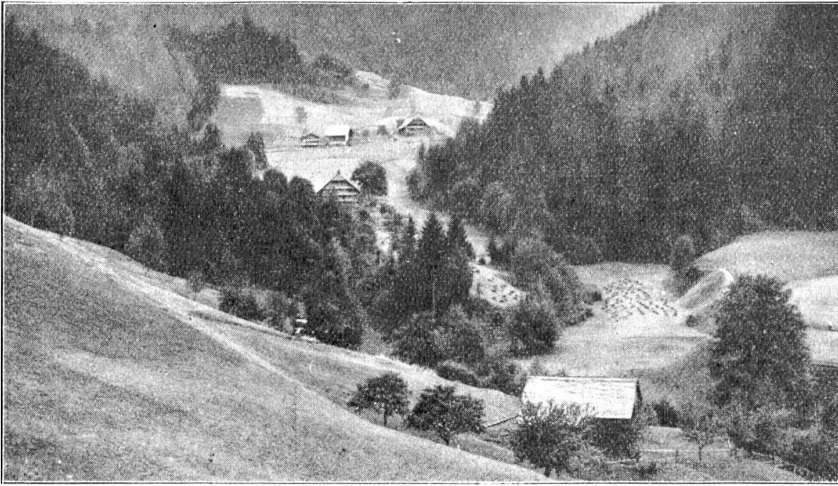
Möslithal, ein Seitentälchen bei Meiersmaad.