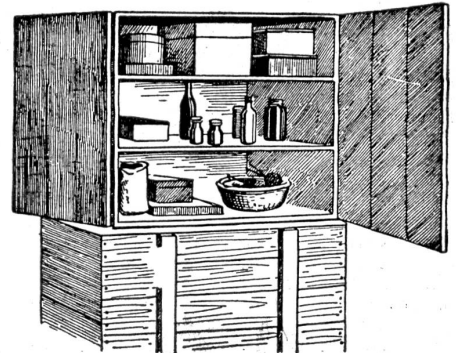
Ausnutzung der Kiste zur Aufbewahrung auf dem Esstisch.