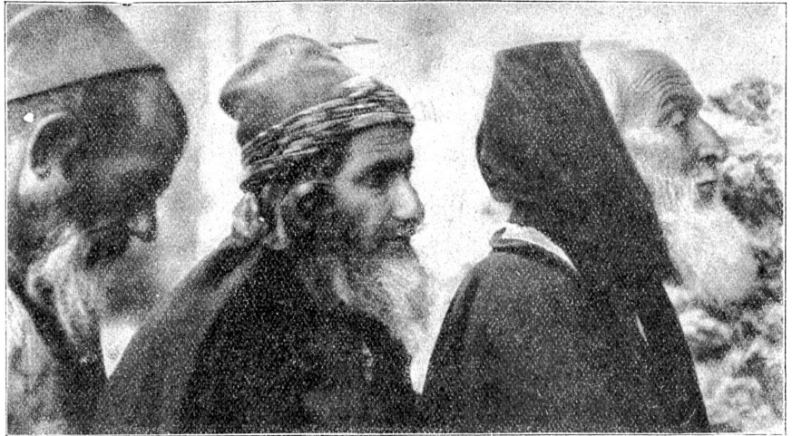
Vor der Klagemauer des Tempels. Juden aus dem heutigen Jerusalem.

Seit Jahrhunderten beanspruchte Hilterfingen am sonnig-milden Thunerseeufer auf 560 Meter Meereshöhe gelegen, das kirchliche Hoheitsrecht über die damals noch recht spärlich besiedelten Berghänge von Heiligen-