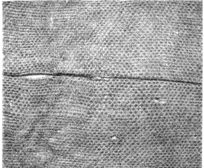
Steinzeitliches Cuchstück mit Naht - Pfahlbau Lüscherz. Innere Station.