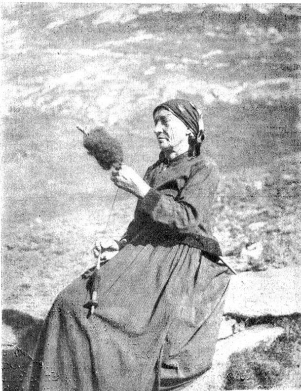
Spinnerin aus dem Wallis (Kiederalp). Der Spinnwirtel zeigt übereinstimmende Form mit denjenigen unserer Pfahlbauten.

Aber die Auswirkung all dieses verschwenderischen Kraftaufwandes, die Brut, die Kinderstube? Fragend stand ich am