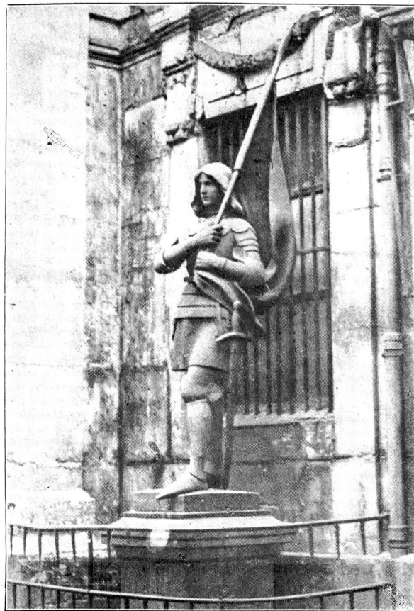
Die Jeanne d'Arc-Statue in Paris.

nicht eher ruhen, als bis der letzte Engländer den französischen Boden verlassen hatte. Sofort ging's nun auf Paris los, das ebenfalls den Engländern gehörte. Inzwischen war in der Normandie eine Erhebung für Karl VII. entstanden,