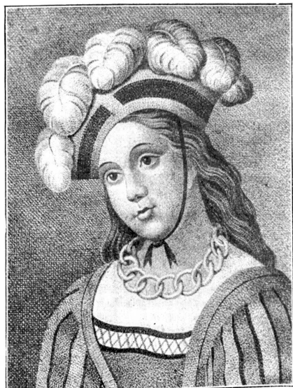
Porträt Jeanne d'Arc.

Am 17. Juli 1429 ging die Krönung vor sich. Johanna hielt während der Feierlichkeit mit ihrer Fahne an der Seite des Königs und begrüßte ihn als erste.