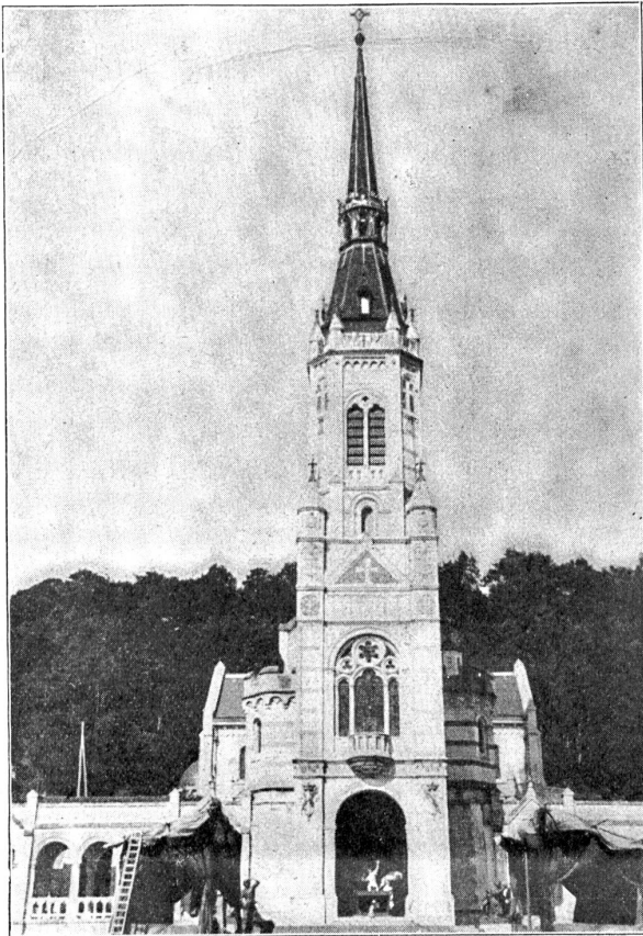
Die Kapelle der heiligen Jeanne d'Arc in Domrémy.

auch hier ungehindert durch die Zernierungstruppen in die Stadt. Bei einem Ausfalle, den sie eines Tages befahl, wurden ihre Truppen von der Uebermacht erdrückt und zurückgeschlagen. Johanna deckte mit der Nachhut den Rück-