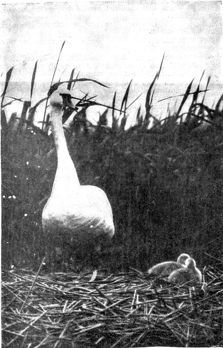
Eine stolze Muttergans.

Hart ist aber auch der Kampf ums Dasein in der Tierwelt. Ergreifend sind die Schilderungen Bengt Bergs von der diebischen Krähe, die die Nester der Kleinvögel plündert oder in einem