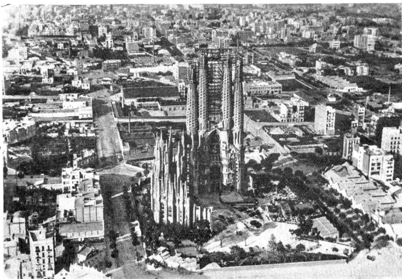
Barcelona, die Hauptstadt Cataloniens (in Spanien). Blick auf die neue Kathedrale.

der stadtberühmten Orgeln im Münster, in der Heiliggeistkirche und in der Pauluskirche beherzigen, was Albert Schweitzer in seinen Forderungen folgenderweise zusammenfaßt: