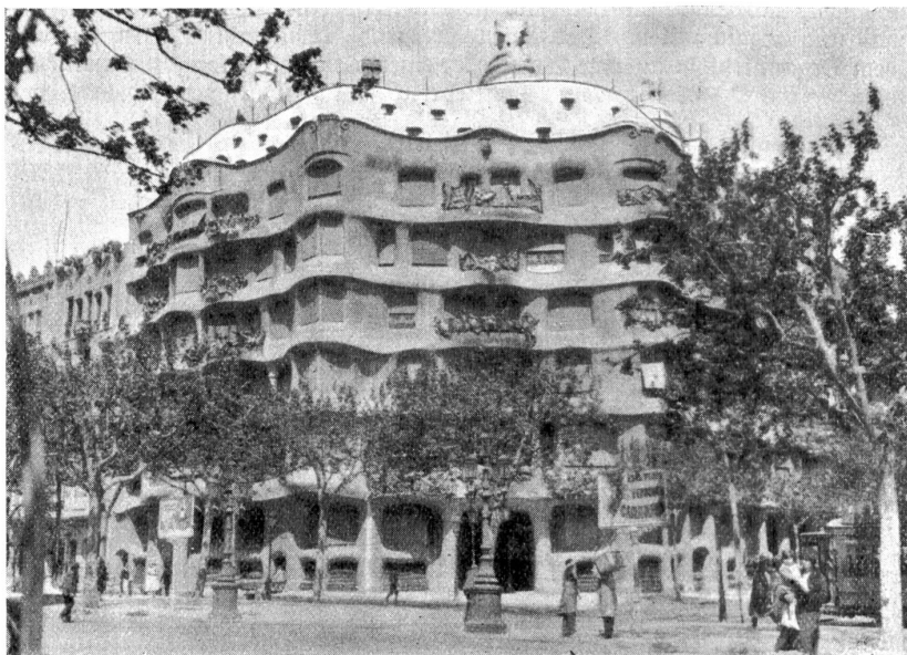
Barcelonas neuer Baustil. Eckhaus auf dem „Paseo de Gracia“ mit wellenförmig bewegter Fassade.

Die erste Platte aus verwittertem Sandstein steht jetzt als Erinnerung im Haus unten im „Erdsäalgen“.