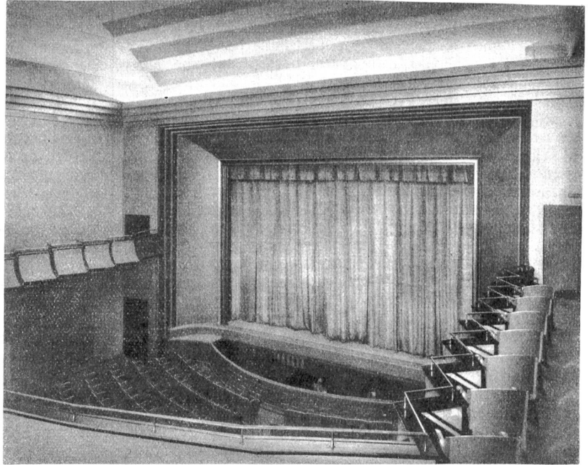
Innenraum. Blick auf die Bühne. (Arch. F. Widmer & Hans Weiß, Bern.)

Interessant sowohl für den Fachmann wie für den Laien sind einige technische Aufgaben. Es war überhaupt keine leichte Aufgabe, zwischen den beiden alten Nachbarshäusern und den beiden begrenzenden Gassen (Mehrgasse und Kramgasse) einen modernen Neubau aufzustellen, besonders wenn man die schiefen, in keiner Weise rechtwinkligen Grenzen berücksichtigt, ferner auch die teilweise ungenügenden Abstützungspunkte in Betracht zieht und zudem die vielen, teilweise sehr scharfen Baupolizeibestimmungen zu berücksichtigen hat. Die Laube an der Kramgasse wurde zur Vorhalle, die Decke dient als Boden für den Teerraum im 1. Stock, während die Mehrgasselaube direkt von der Theaterbühne überdeckt wird. Der Saal bietet bequem für 1000 Personen Platz, er hat eine Länge von 35 Meter und mißt in der Breite gegen 16 Meter. Zwei eiserne Gitterträger von 24 Meter lichter Spannweite bilden die Haupttragkonstruktion des Daches. Die Balkone und Galerien sind in Eisenbetonkonstruktionen ausgeführt. Bemerkenswert ist der weitausladende Teil der großen Galerie, sodaß im Saal überhaupt keine Stützen zu bemerken sind. Besondere Sorgfalt mußte auf die Verbindung der neuen Konstruktionen mit den alten Fassaden verwendet werden. Die Hauptbeleuchtung wird aus dem Lichtnetz des Elektrizitätswerkes Bern mit 2 \times 125 Volt gespeist. Eine zweite Armbeleuchtung kann durch einfachen Hebelgriff vom Dämmerlicht zur vollen Helligkeit umgeschaltet werden. Die dritte