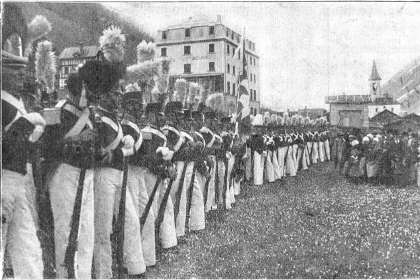
Vom Segensonntag im Lötschenthal. — Uniformierte Lötschentaler.

— und Geld auch, ungezählt; nicht als Almosen, sondern als ehelichen Lohn für fleißiger Hände Arbeit, für das Produkt ihrer Hausweberei, den schweren Wollstoff der aussieht, als ob er ein ganzes Menschenleben überdauern würde. Und wieder möchtest du ihnen bringen, helle, frohe, weltliche — und farbenfrohe Bilder voll warmer Sinnenlust. Es ist ein starker Wunsch in dir, nur ein einziges dieser stillen, ergebenen Gesichter einen Augenblick in Freude aufleuchten zu sehen.