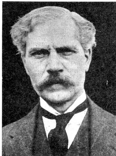
Ramsay Mac Donald, der neugewählte englische Ministerpräsident.

Der neue Kurs in England ist vom Außenminister Henderson, der mit MacDonald und Herriot im Jahre 1924 einer der eifrigsten Apostel des internationalen Friedens und des Aufbaues war, stützt worden. Seine außenpolitischen Etappen und Ziele sind: Aktivierung der Völkerbundstätigkeit (statt wie bisher Hemmung), Verwirklichung des Kelloggpatentes, lokale Anwendung des neuen Reparationsvertrages, Räumung der Rheinlande, Förderung des Abrüstungsplanes, Wiederaufnahme der politischen und wirtschaftlichen Beziehungen mit Rußland. Die letzte Absicht wird erleichtert durch den günstigen Bericht der Studienkommission, die vor den Wahlen heimgekehrt ist. Innenpolitisch steht an der Spitze die Sanierung der Wirtschaft durch Rationalisierung der Industrie und durch Lösung des Arbeitslosenproblems. Entscheidend für den Erfolg ist dabei, daß die neue Regierung nicht ein radikales Parteiprogramm, sondern ein soziales und wirtschaftliches Reformwerk verwirklichen wird, wofür der Großteil des Volkes und der gegnerischen Presse den guten Glauben und die Bereitwilligkeit des Helfens aufbringt. MacDonald kann unter einem sehr gün-