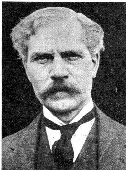
Ramsay Mac Donald, der neugewählte englische Ministerpräsident.

Daneben einige Intermezzi auf dem Welttheater, die Reime zu mehr oder weniger wichtigen Staatsaktionen sind: In der deutschen Sozialdemokratie siegte die Richtung, die aus dem Willen zur Macht das Mögliche ins Auge faßt, Kompromisse mit der Gegenwart schließt und so die Massen in die Hände zu bekommen sucht, um die Zukunft zu beherrschen. Die Lateranverträge sind nun nach dem ersten Freudentaumel und den etwas getrüben vatikanisch-fascistischen Flitterwochen feierlich und fektlich ratifiziert worden. Und das seither bekanntgegebene Staatsgesetz der „Stadt des Vatikans“ dokumentiert, daß Papsttum und Fascismus wenigstens den Absolutismus gemeinsam haben: der Fascismus durch das Korporationsystem, der Papst als selbstherrlicher Monarch. Im Zeitalter der Konstitution und der Volksherrschaft ist dieser Rückfall in das 18. Jahrhundert bemerkenswert. Nicht minder eigenartig sticht im Zeitalter der Internationalität und der Kosmopolitik die nationalistische Tendenz in Norwegen hervor, wo alle Stadtnamen, die irgendwie im Zusammenhang mit der vierhundertjährigen dänischen Fremdherrschaft stehen, um- und rückgetauft werden in ursprüngliche, ältere norwegische Namen. Eine gewisse Komik ist dabei, daß gegen diesen sprachlichen Heimatschutz, der alle teuren Atlanten, Geographiebücher und Reisebücher entwertet, die herrschenden Linksparteien machtlos sind. Die nationale Bewegung ist ein Gegenstück zu andern national betonten Erscheinun-