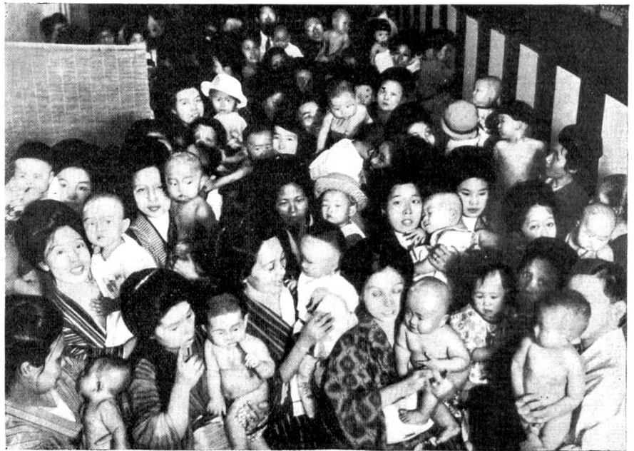
Säuglingsprüfung in Ofaka (Japan).