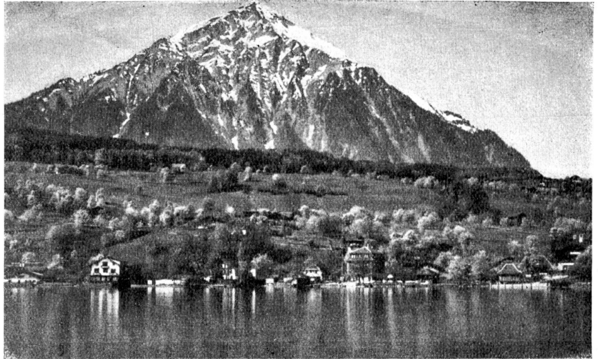
Faulensee mit Dörfen.

Columban war ein irischer Glaubensapostel, der zuerst im Reiche der Merovinger wirkte. Als er aber auch die Königsfamilie zu einem christlicheren Lebenswandel anhalten wollte, fiel er in Ungnade und mußte fliehen. Er wanderte darauf den Rhein aufwärts nach Bregenz und von da über die Bündneralpen nach der Lombardei. Er war, wie Beatus, nie in der Schweiz und kam also auch nicht dazu, im Berner Oberland als Glaubensapostel zu wirken. Diese Sagen-Gruppe wurde von den Augustinermönchen von Interlaken