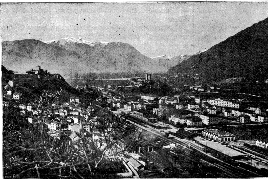
Generalansicht von Bellinzona.

grüßen und die eigentlich veranlassen müßten, hier auszusteigen und einige Stunden oder Tage zu verweilen. Doch die wenigsten der Reisenden unterbrechen ihre Fahrt. Sie wollen möglichst rasch an die herrlichen Gestade des Ceresio oder des Verbano reisen. So blieb Bellinzona in der deutschen Schweiz recht unbekannt. Daher ist die Gelegenheit, den Ort kennen zu lernen, doppelt zu begrüßen. Denn er verdient es, gesehen und genossen zu werden. Wohl fehlen ihm die See- gestade, die prächtigen Anlagen, die großen Hotels. Dafür bietet Bellinzona reichen Ersatz in der Erhaltung seiner alttessinischen Eigenart, die sich in den engen Gassen und Gäßchen, den herrlichen, säulengeschmückten Arkaden, den alten Häusern mit sinnigen Sgraffitomalereien ausprägt, nicht zuletzt in dem landesüblichen Pflaster der Straßen mit den mit Steinplatten belegten Fahrgeleisen.