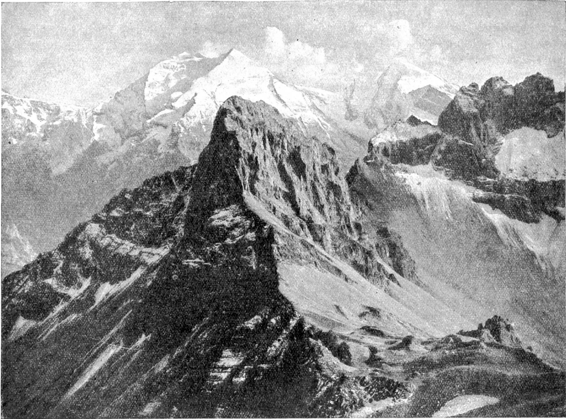
Ausblick vom Bonderspitz (beizWaldboden) auf Kleinen Lohner und Großen Lohner rechts dazwischen die Bonderkeinde. Im Hintergrund Balmhorn und Aitels.

wie mir dieser Zusammenbruch das Herz schwer gemacht hat. Ach, und erst meinem Mann! Wie sehr Sie ihm auch zürnen müssen, durch eine finanzielle Besserung ihrer Verhältnisse, soweit sie möglich, würden Sie ihn seelisch auch aufrichten. Denken Sie auch daran, mir zu Liebe!“