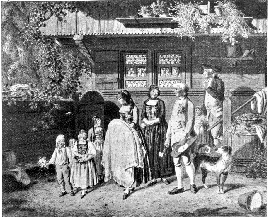
S. R. König: Ausbruch zum Taufgang. (Aus Baud-Boby: Schweizer Bauernkunst.)

„Ei, wie wird so'n großer Junge so ganz ohne Veranlassung seine Mutter küssen wollen!“