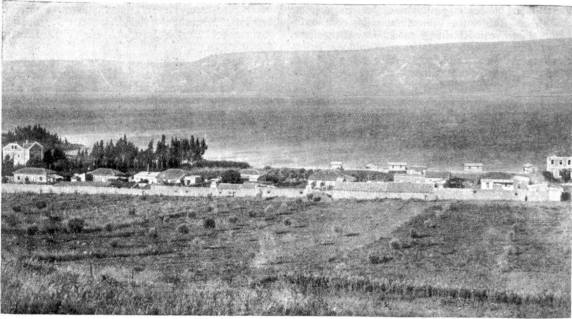
Genezareth-See. Jüdische Kolonie Kinnereth.

seht sind vom flammenden Rot des Mohns und vom Rot des „Blutstropfen“-Hahnenfußes ( Adonis aestivalis ).