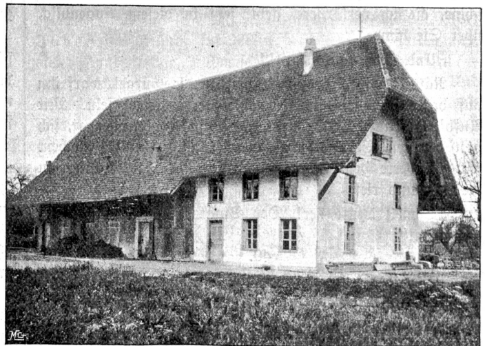
Die Schloßscheuer zu Narwangen, wo das Seminar seinen Anfang nahm.