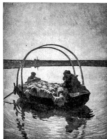
6. Segantini: „Ave Maria“.

ihn auf, führten ihn heim, pflegten ihn. So wurde er von der Welt des Du, der Liebe, angetreten. Dem Drange, sich erkenntlich zu zeigen, folgend, hütete er den Bauern die Schweine. Hier mag seine Liebe zum Bauern-, Hirten- und Tierleben, von dem er uns später so anschaulich und eindringlich erzählt hat, wurzeln. Um 1874 war er Ladungsjunge bei Verwandten im Trentino. Dort machte er mit einem Freund den Fund wertvoller alter Münzen. Er hoffte mit dem Erlös die Kosten für das Studium bestreiten zu können. Aber auf dem Wege nach Mailand machte sich sein Freund mit dem Schatz aus dem Staube. Schmerz und Scham töteten den Jüngling fast. Drei kummervolle Nächte brachte er in einem Heuschuber versteckt zu. Dann zwangen ihn Hungerkrämpfe, sich bemerkbar zu machen. Statt Student wurde er nun Photographengehilfe, dann Lehrling beim Fahnenmaler Tettamanzi. Schließlich war er doch Schüler der Kunstakademie. Er besuchte den Unterricht zwar selten, da er Portraits in Kohle zu 20—25 Rappen das Stück anfertigen mußte, um sein Leben fristen zu können. 1877, also 19jährig, malte er mit dem Rest von Farben, die er zum Anstreichen eines Ladenschildes gebraucht hatte, das Bild „Il Coro di St. Antonio“ auf ein Kaminschild. Damit begründete er sein Künstlerium. Nach ein paar arbeitsreichen Jahren durfte