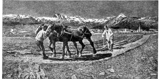
6. Segantini: „Am Pflug“.

derlich, daß in ihm eine grenzenlose Sehnsucht aufkeimte, die ihm später den Pinsel führte, ihn die Mütterlichkeit, überhaupt das Glück des Beziehungslebens bildnern ließ. — Der aufgezungenen Vereinfamung überdrüssig, flog er aus der lichtarmen Dachkammer, aus der Stadt. Bauern sahen ihn erschöpft in einem Graben liegen, hoben