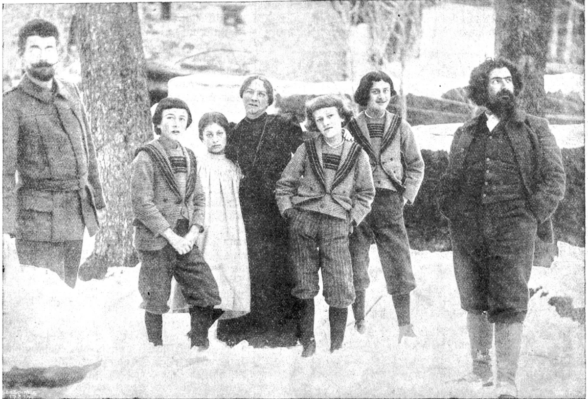
Giovanni Segantini mit seiner Familie und dem Hauslehrer.

Im Werden erblicken wir zunächst eine großgeschauerte Alpenlandschaft. Kühle, taufrische Matten umfassen ein