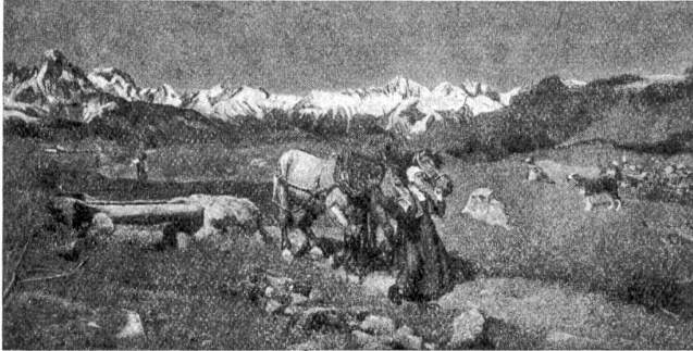
6. Segantini: „Frühling“.

„Lieber Edelstein, an dieser Sache ist ja nun nichts mehr zu ändern. Lassen wir sie ruhen.“