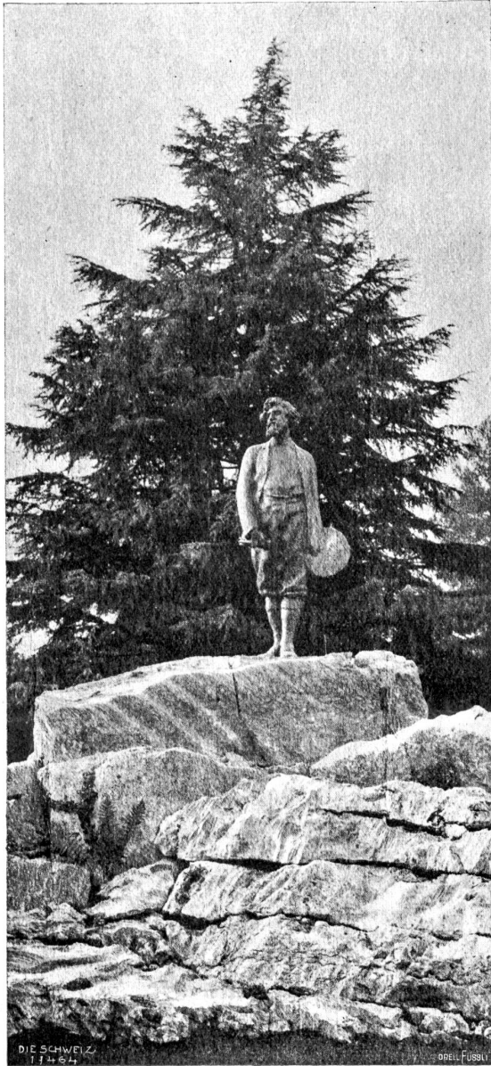
Segantinis Denkmal zu Arco am Gardasee.

Einsamkeit. Dräuend kriecht die Riesenwolke über das besonnte Haupt der trockigen Felspyramide. Kalte, gierige Schatten reden sich nach dem letzten Rest Sonne. Werden