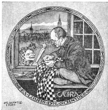
Exlibris Dr. E. Snyder, Arzt für Nervenkrankheiten in Bern.

Sein Werk ist heute noch eine hochachtenswerte Leistung ebenso wie sein Bild „Das Kunsthandwerk“ im Treppenhaus des Kornhauses resp. Gewerbemuseums. Schön ist die Ausmalung der Bernerstube der Zunft zu Mittel-Löwen. Feiner Humor und Beobachtungsgabe kamen zur Anwendung beim großen Fries „Die Stunden des Tages und der Nacht“ im Restaurant Zytglogge. Sein großer Fries im Audi-