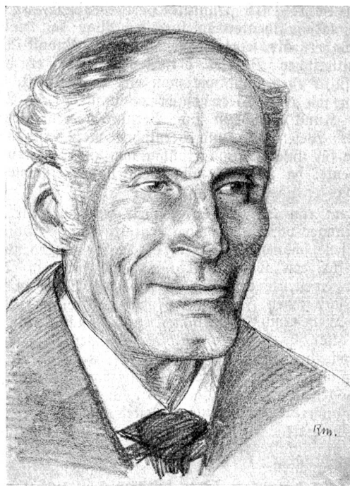
Porträtstudie aus Em. Sriedlis „Bärndütsch“-Bd. „Grindelwald“. (Verlag A. Francke Bern.)

Seine künstlerische Liebe aber galt dem „Gesicht“. Die „Gesichter“ waren die Hauptgegenstände seiner Arbeit an den 7 Bärndütsch-Bänden. Sie alle bezeugen: „Mein Innerstes kehrt du ans Licht des Tages mir entgegen.“ Müngers Blicke waren Röntgenstrahlen, die zwischen festgelegten Zügen auch erst im Werden begriffene entdeckten. Die Retouche war bei ihm verpönt, Wahrheit ihm oberstes Prinzip. Darum das „Danke schön! söll das mü(ch) fii?“ einer