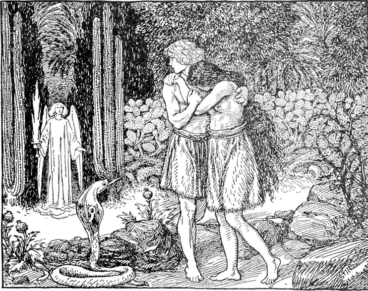
Die Vertreibung aus dem Paradies. (Bernische Kinderbibel, Staatl. Lehnmittelverlag.)

Münger pflegte auch die Bildniskunst in Ausföhrung von Privataufträgen. Nie malte er für Museen oder Ausstellungen. Er fand dazu die nötige Muße nicht. Er konnte sich eben nicht rar und kostbar machen. Jedem Unternehmen, das der Heimatgeschichte und der Heimatpflege dienen wollte: historischen Umzügen, Trachtenfesten, den „Bärndütsch“-Festen, vor allem dem Heimatschutz-Theater, lieb er seinen Rat und seine Kunst. In seinem Haus im Rabental, das er seit 1902 bewohnte und in dem er sich 1912 ein geräumiges Atelier einbauen ließ, empfing er die ungezählten Ratgeber und Hilfebedürftigen, immer freundlich, wohlwollend und zuvorkommend.