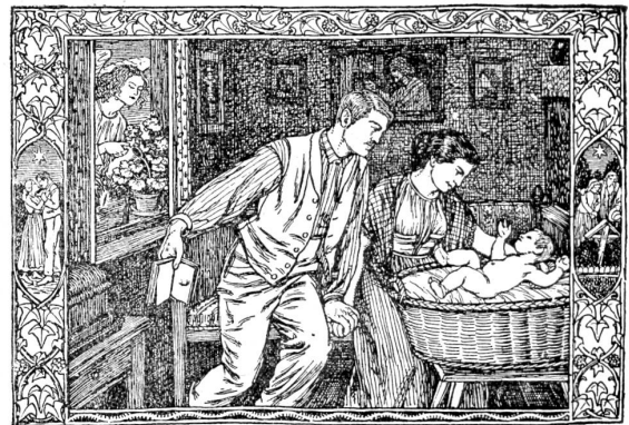
Schweizerisches Kirchengesangbuch. Titelbignette: „Lieder über Ehe und Familie“. (Verlag F. Reinhardt, Basel.)

Münger hat sich aber auch mit größern dekorativen Werken einen guten Namen im Schweizerlande gesichert. Er ist auch da seine eigenen Wege gegangen. Seine Ausmalung des Kornhauskellers war für jene Zeit eine Tat. Man denke sich einmal um 35 Jahre zurück und staune,