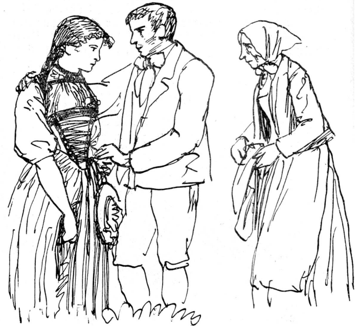
Annemarelli Resli Stini Figurinen zum Heimatschug-Cultspiel „Geld und Geist“ von Simon Geller.

Lebensauffassung. — Ein kleines Erlebnis möchte ich hier noch erwähnen. Ich spielte einmal einen Bauernknecht und