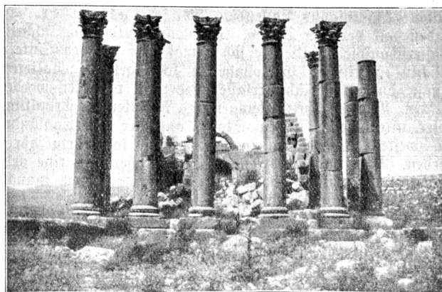
Gerasa (Djerasch) Sonnentempel.

Wir betreten nun das Innere der Stadt Gerasa. Dies durch das ganz bescheiden abseits, d. h. nicht in der Achse der zum Nordtor führenden Hauptstraße liegende, zerfallene Südtor, das den wirkungsvollen Abschluß der Hauptstraße durch das sogenannte Forum und die Entwicklung der Prachtbauten am Südrande der Stadt nicht stören durfte, und sich wahrscheinlich aus diesem Grunde mit einem Platz östlich von dieser Straße begnügen mußte. Zunächst wenden wir uns zu den links an einem Hügel stehenden Ruinen eines Tempels, von dem nur noch die Südwand der Cella erhalten ist. Neben an, an die Stadtmauer angelehnt, liegt das südliche Theater, das gegen 5000 Zuschauer faßte und noch jetzt über 32 gut erhaltene Sitzreihen, sowie über eine vorzügliche Akustik verfügt. Von hier aus über-