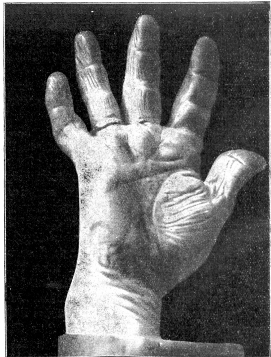
Die Hand eines Schuhmachers.

Betrachten wir die Hand eines Schuhmachers! Die rechte Hand ist aus naheliegenden Gründen ausgeprägter als die linke. Der Daumen ist breit und flach, und diese Veränderung zeigt sich in ähnlicher Weise an allen andern Fingern. Der Schuster benützt täglich seinen Daumen, um das aufgenagelte Leder für Absatz oder Sohle an den Schuh zu pressen und um dem Ledermesser, das ein zähes und widerstrebendes Material zu bearbeiten hat, eine feste Stütze zu geben. Die Vorderglieder der andern Finger sind auch breiter geworden, weil sich beim Verarbeiten des harten Materials stets beträchtlichen Druck ausüben müssen. An den Ballen sind Verdickungen und Schwielen zu beobachten. Der rechte Zeigefinger ist besonders bemerkenswert, das zeigt uns die Abbildung deutlich. Die daumenseitige Fläche der Fingerspitze ist stark abgeflacht, so daß im Gegensatz