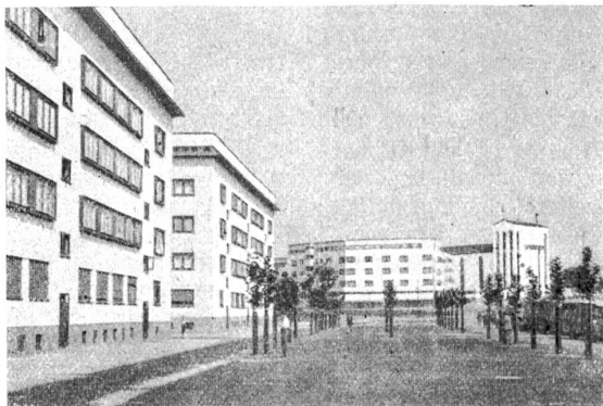
Ansicht aus einer neuen Wohnkolonie in Frankfurt a. M.

Wir kennen auch in der Schweiz Siedlungen, die sich aus meist kleinern Wohnhäusern zusammensetzen und sich